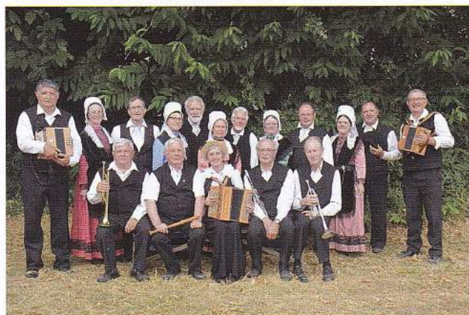
Les Danseurs du Chaboussant

23h : Grands feux pyromélodiques, suivi du Concert rock gratuit de "Tête de Ouf" à L'Orangerie