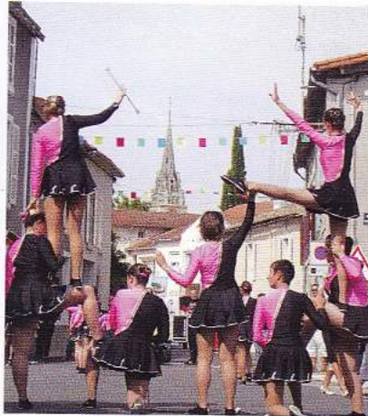
départ de l'Orangerie et traversée du bourg

15h : départ de la grande cavalcade de clôture avec animations musicales.