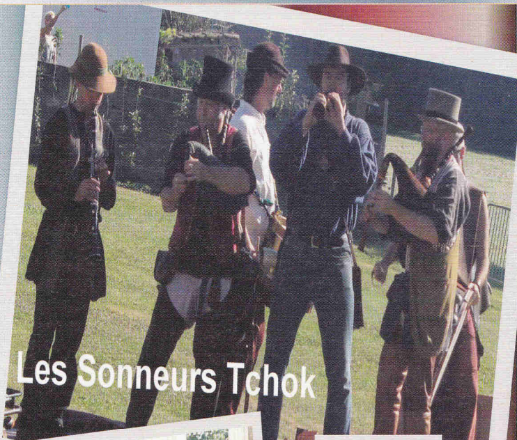
Les Sonneurs Tchok