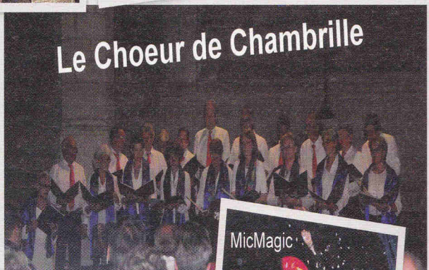
Le Choeur de Chambrille