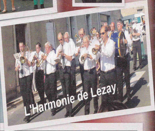
L'Harmonie de Lezay