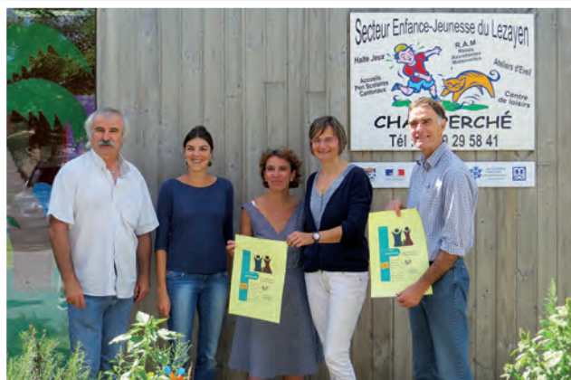
Nouveau Service d'Accueil Enfant Parent