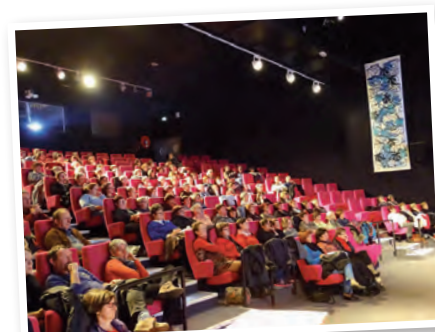
Les agents concernés par le transfert de la compétence scolaire réunis au Metullum en novembre 2015.