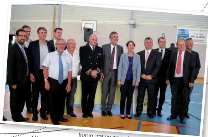
Inauguration en présence de Ségolène ROYAL, Ministre de l'Ecologie, du Développement durable et de l'Energie