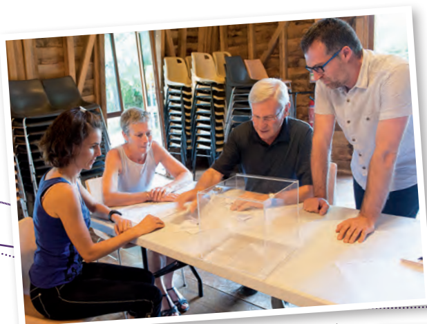
Dépouillement des votes des conseillers communautaires