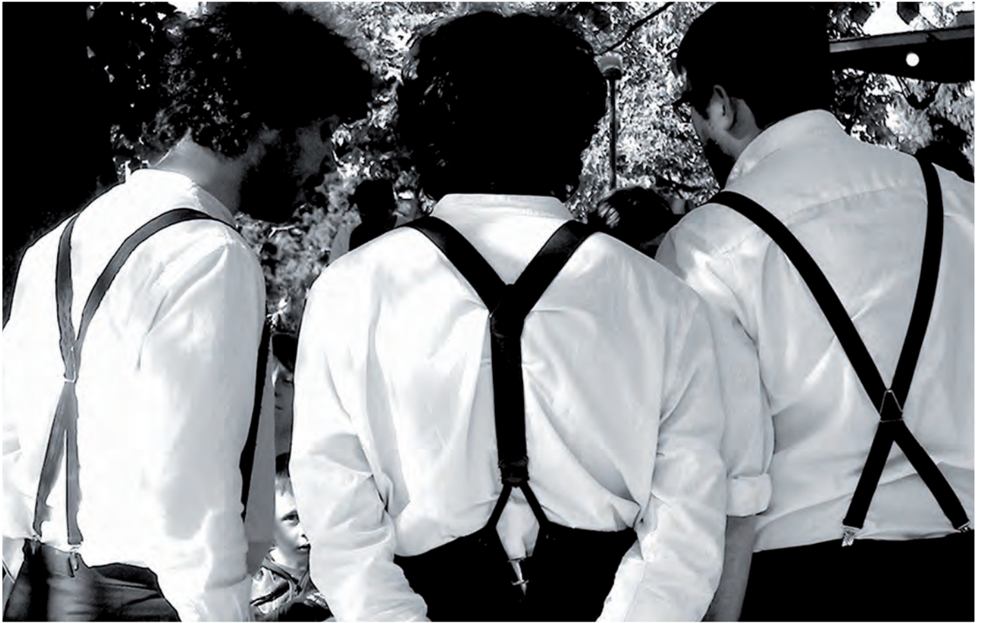
Concert "Garçon s'il vous plaît" à Saint-Vincent-la-Châtre le 13 février